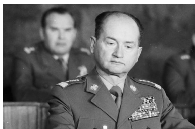
Wojciech Jaruzelski i (1923-2014), w latach 1981-1989 I sekretarz Komitetu Centralnego Polskiej Zjednoczonej Partii Robotniczej