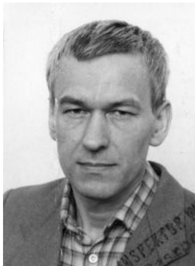
Kornel Andrzej Morawiecki (1941-2019), działacz opozycji demokratycznej i antykomunistycznej w czasach PRL, założyciel i przewodniczący Solidarności Walczącej

We Wrocławiu przynajmniej więc dostrzeżono problem. Ale sam apel – podobnie jak inne wystąpienia tego typu – miał charakter magiczny. Do żołnierzy w ściśle izolowanych koszarach nie mógł dotrzeć.