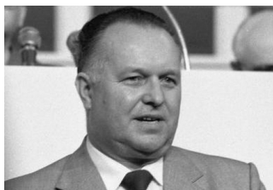
Stanisław Kania (1927-2020), w latach 1980-1981 I sekretarz Komitetu Centralnego Polskiej Zjednoczonej Partii Robotniczej

Natomiast ustami nowego I sekretarza – Wojciecha Jaruzelskiego – władza przestrzegła, iż „możliwości odwrotu zostały już wyczerpane”. Sugerowało to ewentualność sięgnięcia po środki nadzwyczajne, choć zarówno działacze Związku, jak i zwykli obywatele w gruncie rzeczy takiego rozstrzygnięcia po prostu nie brali pod uwagę.