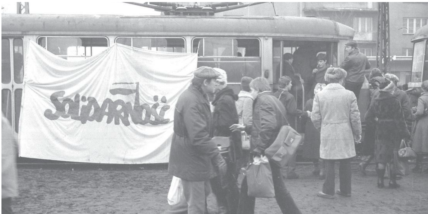
Pacyfikacja Strajku w Wyższej Oficerskiej Szkole Poznańskiej

https://przystanekhistoria.pl/pa2/teksty/77117,Zamach-grudniowy.html