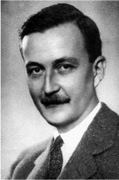
János Esterházy (1901-1957).