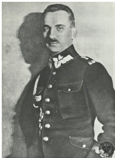
Gen. Kazimierz Sosnkowski, którego János Esterházy osobiście przewiózł do Budapesztu na węgierskim etapie przedostawania się generała do Francji po klęsce Polski w wojnie obronnej 1939 r.

W nowo powstałym państwie słowackim Esterházy dalej był posłem do parlamentu. Od razu przystąpił też do konkretnych działań, by pomóc swym rodakom znajdującym się w trudnej sytuacji bytowej. Główną jego inicjatywą był program o nazwie Dom Węgierski. Organizowano zbiórki pieniędzy na wybudowanie na Słowacji ośrodków dla węgierskich partii politycznych, stowarzyszeń kulturalnych, księgarń, świetlic, sal teatralnych i kinowych oraz ciepłych izb dla biednych. Esterházy rozpoczął również wydawanie gazety „Új Hirek” („Nowe Wiadomości”). Chociaż na jej łamach apelował o pokojowe współżycie Słowaków i Węgrów, to tytuł był wielokrotnie zawieszany, cenzurowany, a poszczególne numery konfiskowano.