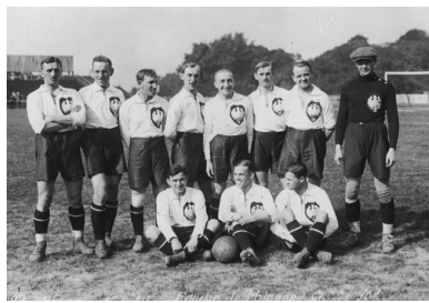
Fotografia grupowa piłkarzy z klubu sportowego Strzelec Siedlce im. płk. K. Hozera przed meczem z Legią Warszawa na stadionie w stolicy, sierpień 1934 r.