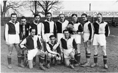
Drużyna piłkarska klubu sportowego Jutrzenka Lwów, 1935 r.