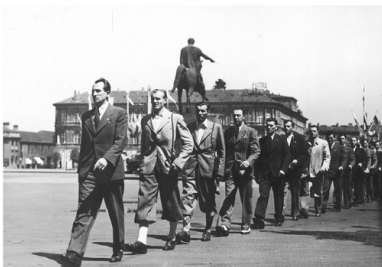
Piłkarze szwajcarscy, przybyli na mecz z reprezentacją Polski, na warszawskim placu Marszałka

Do legendy przeszedł sensacyjnie przegrany (1:2) w 1917 r. przez Cracovię mecz z drużyną legionową, zwaną Legią. Wynik nie może jednak dziwić, bowiem galimatias na boisku panował niebywały. Po murawie biegało 14 zawodników Cracovii (po 7 w Cracovii i Legii), pięciu wiślaków (czterech w Cracovii i jeden w Legii) oraz trzech lwowiaków w Legii. Cracovia musiała uzupełnić skład juniorami.