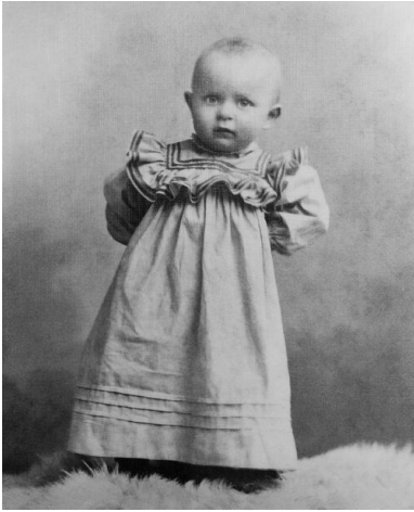
Mały Lolek, Wadowice, 1921.

Gdy dla pani Emilii nadszedł dzień rozwiązania, urodził się duży, silny chłopiec. Przez otwarte okna z pobliskiego kościoła dobiegał dźwięk dzwonów i śpiew Litanii loretańskiej. Był 18 maja 1920 r.