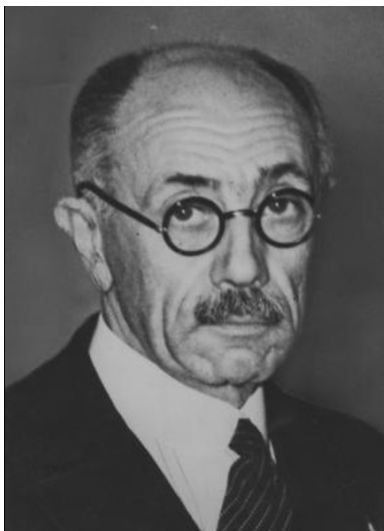
Pál Teleki.

Fundusze zebrane przy hojnym wsparciu arystokracji (nie bez znaczenia były tu silnie tradycje polsko-węgierskie), pozwoliły na zakwaterowanie elit urzędniczych napływających z okupowanej Polski w najlepszych budapeszteńskich hotelach, takich jak Metropol, Imperial, Hotel Dworcowy i Grand, oraz w prywatnych pensjonatach, np. Palace i Comfort.