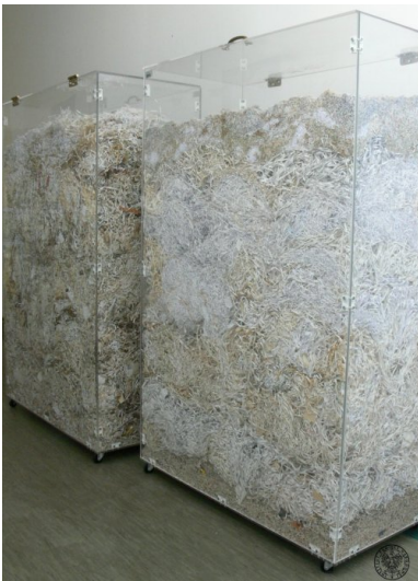
Gabloty ze zniszczonymi aktami służb terroru i represji PRL

uznano za konieczne ich internowanie (w ramach akcji o kryptonimie „Jodła”) z chwilą wprowadzenia stanu wojennego. W odróżnieniu od akt lustrowanego TW „Jędrka”, teczki pozostałych dwóch TW o pseudonimach „Anhelli” i „Sufler” zachowały się. W teczkach obu tych TW zachowały się zarówno pobierane w ramach akcji „Klon” lojalki, jak i pisemne zobowiązania do ich współpracy z SB. Dokumentacja z tych akt, jak i weryfikujące ją przesłuchania obrazowały zupełnie inne losy tych dwóch osób: TW „Sufler” współpracował z SB do roku 1990 i był bardzo cenionym źródłem – co potwierdził jego drugi oficer prowadzący oraz sam TW przesłuchany jako świadek. Natomiast TW „Anhelli” podczas pierwszego spotkania po werbunku, w lutym 1982 roku stanowczo odmówił współpracy i oświadczył funkcjonariuszowi, że zobowiązanie podpisał pod presją i ze strachu, ale obecnie odmawia wszelkich kontaktów i jest gotów ponieść tego konsekwencje. Sprawy te miały jeden wspólny mianownik: dokumentacja TW była prowadzona przez funkcjonariusza bardzo rzetelnie i odzwierciedlała jego rzeczywiste kontakty z tymi osobami, a odmawiający współpracy TW „Anhelli” został niezwłocznie wykreślony z rejestru TW – co wytrącało argumenty o rzekomo fikcyjnej rejestracji „dla poprawienia statystyki” co do lustrowanego TW „Jędrka”.