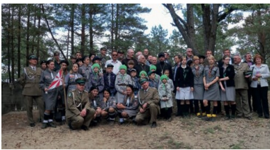
Rekonesans historyczny z harcierzami z Hufca Wołyń na Łysej Górze (okolice Tynnego), lato 2011 r.

Miejscowa ludność niechętnie udzielała wówczas informacji – wszak byłem obcy, pytałem o rok 1939. Często opowieści były z sobą sprzeczne i odsuwały mnie od ustalenia, gdzie znajdują się miejsca pochówku żołnierzy KOP poległych i zamordowanych przez NKWD. Być może ludzie nie chcieli wracać do tych wspomnień, może niewiele wiedzieli, może nie byli pewni, czy nie chodzi mi o ofiary ukraińskich rzezi z 1943 r., do których doszło także w Tynnem 16 , a może były to osoby, które osiedlono w Tynnem już po wojnie.