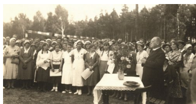
Dzień Pieśni Polskiej w Zakrzewie, 1935 r.

Dla terenów archidiecezji gnieźnieńskiej i poznańskiej oraz diecezji chełmińskiej, które po zakończeniu I wojny światowej znalazły się poza granicami Polski, w dwudziestoleciu międzywojennym utworzono odrębną strukturę kościelną. Kiedy bowiem część dekanatów z obu archidiecezji znalazła się poza granicami Polski, kard. Edmund Dalbor 22 listopada 1920 r. utworzył dla nich delegaturę arcybiskupią z siedzibą w Tucznie, która została rozszerzona 3 sierpnia 1922 r. o trzy dekanaty chełmińskie. Niespełna rok później, 14 maja 1923 r., decyzją Stolicy Apostolskiej delegatura została przemianowana na administraturę apostolską, stając się samodzielnym terytorium administracji kościelnej. W październiku 1926 r. jej siedzibę przeniesiono z Tuczna do Piły. Kolejną ważną datą w dziejach tych dekanatów stał się dzień 13 sierpnia 1930 r., kiedy to Pius XI, w ramach konstytucji apostolskiej Pastoralis officii nostri , utworzył z nich prałaturę „nullius” (terytorialną). Tak powstała Wolna Prałatura Pilska (łac. Territorialis Praelatura Schneidemuhleensis , niem. Freie Prälatur Schneidemühl ).