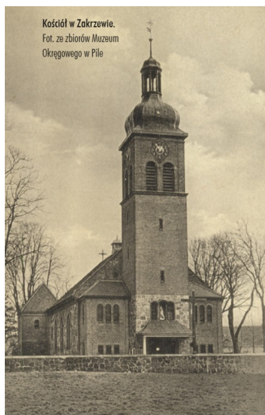
Kościół w Zakrzewie.