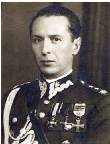
Generał Stanisław Tatar (1896-1980)

W tym momencie wszystko stało się jasne – pierwsza depesza informująca o podjęciu jawnej walki w Warszawie została wysłana do Bazy we Włoszech. Stamtąd bowiem władze Polskiego Państwa Podziemnego spodziewały się uzyskać pomoc w postaci zrzutów lotniczych. Depesza była zaadresowana do premiera Stanisława Mikołajczyka i do Naczelnego Wodza gen. Kazimierza Sosnkowskiego.