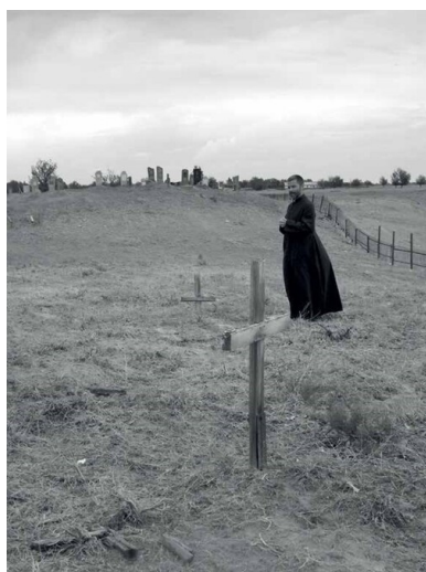
Cmentarz dzieci z sierocińca w Mojun-Kumie.