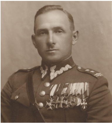
Podpułkownik - wrzesień 1935

Po kapitulacji Warszawy przebywał w obozach jenieckich – m.in. w Bergen Belsen, Sandbostel i Lubece. skąd uwolniły go wojska amerykańskie. Na krótko trafił wówczas do Włoch, gdzie działał w sztabie II Korpusu, jednak w 1946 r. przeniósł się na stałe do Londynu.