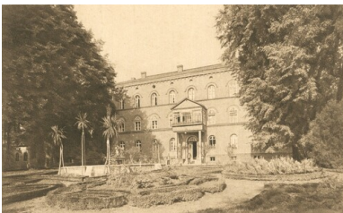
Świecie nad Wisłą, dom dyrektora zakładu psychiatrycznego.