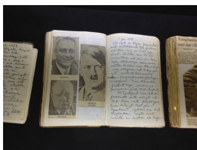
Przykładowe karty z „dziennika wojennego” eksponowane podczas wystawy „The whole world is on fire”.

Opisywanie dramatycznych losów II wojny światowej rozpoczęła 1 września 1939 r. W oparciu o informacje głównie dostarczane przez prasę i radio stworzyła obraz Szwecji i życia codziennego szwedzkiej rodziny w dobie konfliktu międzynarodowego. Każdego roku, kilka razy w miesiącu, przedstawiała wydarzenia wojenne i wielką, światową politykę dołączając do wpisów wycinki prasowe z artykułami, mapami i zdjęciami. Nadto, po roku od wybuchu wojny, cennym źródłem informacji do jej opisu stały się listy wojskowe i prywatne z zagranicy, do których dostęp uzyskała w związku z podjęciem pracy w tajnej cenzurze korespondencji. Stąd w „Dziennikach” znaleźć można cytaty stanowiące „wstrząsające świadectwa cywili, których dosięgła wojna”. A „dosięgła” ona przecież i Polaków. Stąd pojawia się pytanie o Polskę w świetle relacji Lindgren.