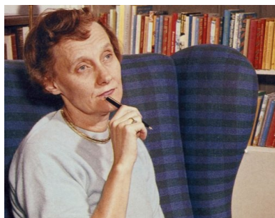
Astrid Lindgren, 1960 r.

Warszawy i zajęcie Bornholmu przez Rosję, co czyniło w jej opinii „kwestię Polską” trudną, dodając przy tym odpis listu z okresu pracy w cenzurze korespondencji i wymowne zdanie: Boję się Rosjan . Z tych kilku wzmianek o Polsce, poza smutnym wizerunkiem kraju ogarniętego wojną, przebija się bunt autorki przeciwko totalitaryzmem Hitlera i Stalina, które do tego doprowadziły i współczucie dla ich ofiar. Oskarżeniom kierowanym pod adresem rządzących Niemcami i Rosją towarzyszy w „Dziennikach” niejako wstyd za pozorną neutralność Szwecji.