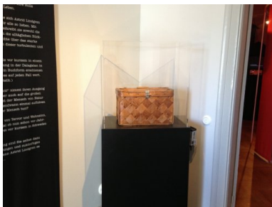
Koszyk, w którym przechowywano „dziennik wojenny” - eksponat wystawy „The whole world is on fire”. Fot.

„Napaść, zrzucanie bomb i strzelanie z karabinów maszynowych do kobiet i dzieci w Finlandii, [...] tragedia ludności w Polsce za zaciągniętymi kulisami (nikt nie może wiedzieć, co się tam dzieje, ale trochę mimo wszystko jest w gazetach), specjalnie wydzielone części w tramwajach dla «niemieckiego narodu panów», Polacy nie mogą wychodzić po godz. 8 wieczór, i wiele innych w tym samym stylu”.