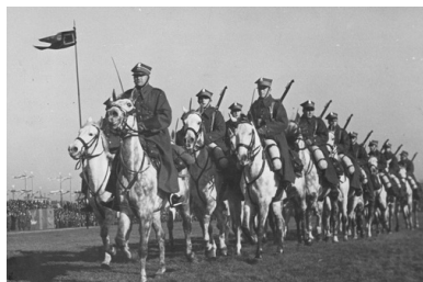
Defilada 6 Pułku Ułanów Kaniowskich podczas Świąta Niepodległości na Polu Mokotowskim w Warszawie, 11 listopada 1934 r.