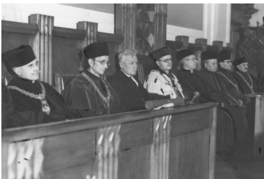
Uroczystość nadania tytułu doktora honoris causa

Wydarzenia z 6 listopada były bezprecedensowe. Nieprzypadkowo zbiegły się z przygotowaniem do otwarcia roku akademickiego w Uniwersytecie Jagiellońskim, a kierując się troską o losy akademii, na wyznaczone spotkanie tłumnie przybyli nie tylko czynni pracownicy nauki, ale i emerytowani profesorowie. Pobyt w obozie był dla nich niezwykle wyniszczający. Pomimo, że „grupa krakowska” nie była zmuszana do pracy, jednak jako tzw. Stehkommando w trakcie dnia nie mogli siedzieć. Rujnujące zdrowie były apele. Przyczyniła się do tego bardzo mroźna zima, lekkie obozowe ubranie, głód, brak możliwości leczenia.