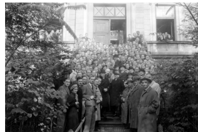
Jubileusz 40-lecia pracy naukowej Kazimierza Kostaneckiego (w