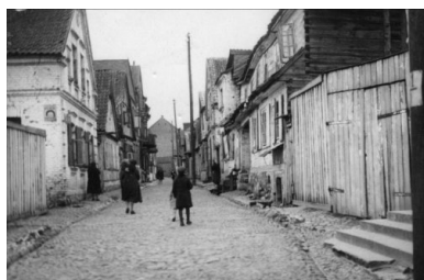
Białystok, ul. Ludwika Zamenhofa. Okres Drugiej Rzeczypospolitej.