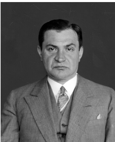
Bronisław Pieracki, minister

15 czerwca 1934 r. zamachowiec samobójca wspomagany przez dwóch obserwatorów Mykołę Łebeda i Darię Hnatkiwską oczekiwał na ofiarę przed Klubem Towarzyskim przy ul. Foksal w Warszawie, w którym często spotykali się politycy obozu rządzącego, wysokiej rangi wojskowi i przemysłowcy. O 15.30 minister przyjechał służbową limuzyną, prowadzoną przez szofera. Gdy wysiadł z samochodu, na dany znak przez Łebeda, Maciejko ruszył za nim. Zamachowiec podszedł do Pierackiego od tyłu i usiłował zdetonować przygotowaną wcześniej bombę. Włączenie mechanizmu detonującego nie nastąpiło, ponieważ nie udało się zgnieść szklanej rurki. Wobec takiego rozwoju sytuacji, „Gonta” wyciągnął rewolwer i trzykrotnie strzelił do Pierackiego, trafiając go w tył głowy.