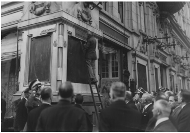
Uroczystość przemianowania ulicy Foksal w Warszawie na ulicę Bronisława Pierackiego. Czerwiec 1934.

W wyniku intensyfikacji działań po zabójstwie ministra Pierackiego wykryto i aresztowano całą Krajową Egzekutywę OUN, ponadto w Berezie Kartuskiej osadzono 176 innych członków organizacji. Działania władz polskich zahamowały częściowo terror ukraińskich nacjonalistów. Jednak OUN jeszcze przed 1939 r. zdołał się odrodzić i dokonać nowych zbrodni.