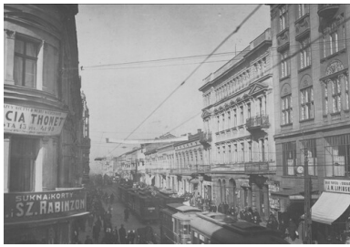
Ulica Piotrkowska w Łodzi. Lata 20. XX w. Druga Rzeczpospolita.