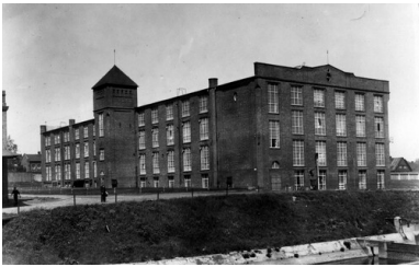
Zakłady Włókiennicze Widzewska Manufaktura S.A. w Łodzi - budynek przędzalni egipskiej. 1938. Druga Rzeczpospolita.

W okresie międzywojennym miasto nie odzyskało dawnej świetności. Działo wraz z całą II Rzeczpospolitą ekonomiczne trudności polskiego międzywojnia – kryzys powojenny; chaos hiperinflacji w latach 1922–1923 oraz zapaść Wielkiej Depresji z pierwszej połowy lat trzydziestych. Sytuację ekonomiczną Łodzi pogłębiał jeszcze permanentny lokalny kryzys gospodarczy, wynikający z utraty wschodnich rynków zbytu i rosyjskiego zaplecza surowcowego. Ten stan rzeczy wpływał negatywnie na atrakcyjność dawnego polskiego Manchesteru jako ewentualnego celu zarobkowej migracji – nawet w sytuacji, gdy w Polsce międzywojennej Łódź stała się stolicą nowego województwa. Liczebność mieszkańców miasta rosła wolniej niż w okresie poprzedzającym wybuch I wojny światowej. Na skutek przyrostu naturalnego, ale przede wszystkim powrotu łodzian, którzy opuścili miasto w latach wojny, i nowych migracji ludności wiejskiej z prowincji, nad Łódką w 1919 r. mieszkało ponad 400 tys. osób, w 1931 r. – ok. 605 tys., wreszcie w 1939 r., w przededniu II wojny światowej – przeszło 670 tys. Polaków, Żydów i Niemców.