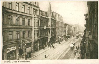
Łódź, ul. Piotrkowska. Przed 1939. Pocztówka ze zbiorów cyfrowych Biblioteki Narodowej ("polona.pl")

miejskiej na prowincję, gdzie łatwiej było przeżyć wojenną zawieruchę. W wyniku tej migracji populacja Łodzi skurczyła się w okresie wojny niemal o połowę i w 1918 r. liczyła tylko nieco ponad 300 tys. mieszkańców.