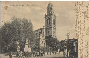
Łódź, kościół św. Krzyża. 1911. Ziemie polskie pod okupacją Rosjan, Niemców i Austriaków. Pocztówka ze zbiorów cyfrowych Biblioteki Narodowej ("polona.pl")

W okresie międzywojennym miasto dzieliło wraz z całą II Rzeczpospolitą ekonomiczne trudności polskiego międzywojnia - kryzys powojenny; chaos hiperinflacji w latach