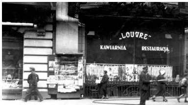
Kawiarnia-restauracja Louvre w Łodzi. 1932. Druga Rzeczpospolita.

Po zakończeniu wojny lukę po Żydach, Niemcach oraz wywiezionych w latach wojny i zamordowanych Polakach wypełniły fale migrującej z prowincji ludności wiejskiej oraz łódzian powracających do rodzinnego miasta z robót przymusowych w Rzeszy i z deportacji do Generalnego Gubernatorstwa. W drugiej połowie 1945 r. zaczęła się też odbudowywać społeczność żydowska w Łodzi. Do miasta napływali Żydzi, którzy ocalili z zagłady na ziemiach polskich, a także ich rodacy repatriowani ze Związku Sowieckiego. 2 Na początku 1946 r. w Łodzi mieszkało już prawie 30 tys. Żydów. Miasto okazało się jednak przede wszystkim przystankiem w ich dalszej wędrówce do Izraela, krajów zachodniej Europy i Stanów Zjednoczonych. Po utworzeniu państwa żydowskiego w 1948 r., w drugiej połowie lat pięćdziesiątych i po wydarzeniach marcowych w 1968 r. łódzcy Żydzi w ogromnej większości wyemigrowali z Polski, opuszczając miasto swych przodków. Na skutek zagłady i emigracji społeczności żydowskiej, ucieczki i przesiedlenia Niemców, a także napływu ludności polskiej z prowincji i przesiedlonej ze wschodu powojenna Łódź stała się w zasadzie miastem jednonarodowym i