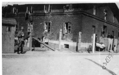
Wysiedlanie kutnowskich Żydów do getta, 16 czerwca 1940 r.