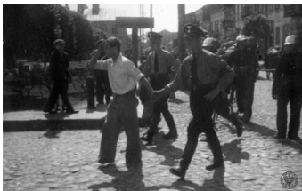
Mężczyzna aresztowany w czasie przesiedlania Żydów do getta w Kutnie w eskorcie dwóch esesmanów na Adolf-Hitler-Platz (obecnie pl. Marszałka Józefa Piłsudskiego) w Kutnie, 16 czerwca 1940 r.

Jakże smutny widok przedstawiała «Konstancja» pierwszego wieczoru. Najsilniejsi płakali, 95% było bez dachu nad głową. Głodne po tym tragicznym dniu dzieci usypiały na leżących tłumokach pościeli pod gołym niebem, przy nich w różnych pozach – jedne klęczały, drugie leżały – matki szeptały słowa modlitwy czy bólu lub patrzyły bezradnie na mężczyzn. Mężczyźni jakże różnie reagowali na tę niemą czy wypowiedzianą rozpacz. Słyszało się przekleństwa czy słowa «kiedy przyjdzie dzień zapłaty », jedni zaciskali pięści, drudzy zachowywali się jak kobiety. W oczach niektórych widać było jakieś silne postanowienie, zaciśnięte usta potwierdzały to prawdopodobnie. Zdawało się, że ich spojrzenia mówią: cierpimy, ale trzeba jakoś zaradzić, musimy w tych tragicznych warunkach umieć żyć. Pragnienie przeżycia miało taką siłę, że wynik różnych rozmyślań dał się widzieć nazajutrz..., w «Konstancji» zawrzało jak w ulu. Energiczniejsi zrozumieli, że skoro muszą tu żyć, muszą sobie to życie ułatwić. Jedni chwyтали się za robienie pałatek, inni wyrzucali żelastwo z fabryki, chcąc ustawić łóżko, bo łóżko było w getcie najniezbędniejszym meblem: na łóżku się spało, jadło, siedziało, ubierało, pod łóżkiem umieszczano statki kuchenne, rzeczy, żywność i inne konieczne rzeczy. Inni zbierali cegłę, by z cegły i gliny skombinować mieszkanie. Zachęcano tych, którzy nie mieli własnej inicjatywy.”