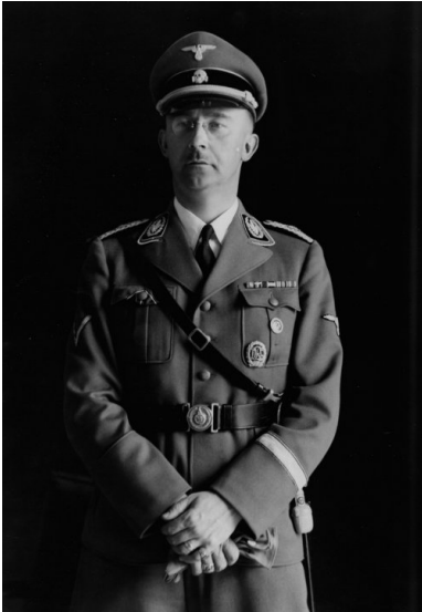
Heinrich Himmler, szef policji i SS w III Rzeszy. Fotografia portretowa wykonana z okazji 40. rocznicy urodzin. Październik 1940.

zakończenia rozpętanej przez siebie wojny. 30 kwietnia 1945 r., w wieku 56 lat, dzień po poślubieniu swojej wieloletniej partnerki Ewy Braun, popełnił wraz z nią samobójstwo. Miało to miejsce w bunkrze znajdującym się pod gmachem Starej Kancelarii Rzeszy w Berlinie, skąd do końca swoich dni kierował działaniami zbrojnymi upadającego państwa.