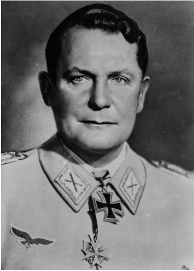
Hermann Göring, marszałek niemiecki. Fotografia portretowa wykonana z okazji 52. rocznicy urodzin. Styczeń 1945.