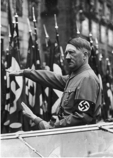
Kanclerz Rzeszy Adolf Hitler odbierający defiladę. Maj 1937.

W skład Trybunału Norymberskiego wchodził przedstawiciel czterech zwycięskich mocarstw - USA, Wielkiej Brytanii, Francji i ZSRS. Każde z państw delegowało po dwóch reprezentantów swojego kraju do składu sędziowskiego oraz po jednym do Komitetu Oskarżycielskiego, do którego należeli prokuratorzy.