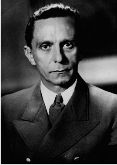
Joseph Goebbels, minister propagandy III Rzeszy. Fotografia portretowa wykonana z okazji 46. rocznicy urodzin. Listopad 1943.