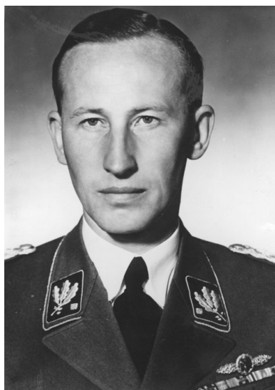
Reinhard Heydrich, generał SS i szef Głównego Urzędu Bezpieczeństwa Rzeszy. 1942.

Losy Heinricha Müllera, szefa Gestapo, odpowiedzialnego bezpośrednio za wszystkie zbrodnie popełnione przez tę jednostkę, owiane są tajemnicą. Zagorzały zwolennik Holokaustu i niezwykle skuteczny dowódca zniknął bez wieści tuż po zakończeniu wojny. Teorii na temat jego dalszych losów jest wiele. Spekulowano o podjęciu przez niego współpracy z wywiadem amerykańskim, przejściu na rosyjską stronę i ucieczce do Moskwy, a nawet o emigracji do Ameryki Południowej, która była popularnym wśród nazistów miejscem ukrywania się. W 1945 r. został oficjalnie uznany za zmarłego w wyniku samobójstwa w podziemiach kościoła św. Trójcy w Berlinie. Teoria ta została poddana w wątpliwość, gdy po ekshumacji zwłok z miejsca rzekomego pochówku okazało się, że żadne ze znajdujących się tam trzech ciał nie należy do niego. Prawdziwe losy Müllera do dziś pozostają nieznane.