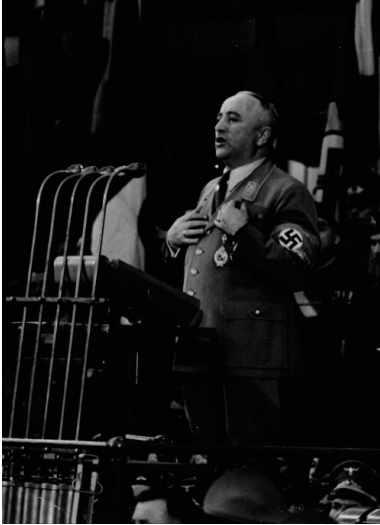
Szef niemieckiego Frontu Pracy, Robert Ley wygłasza przemówienie. Między 1939 a 1945.

Po zakończeniu procesu w sprawie głównych zbrodniarzy hitlerowskich trwały ożywione negocjacje dotyczące dopuszczalności wszczęcia kolejnego postępowania przed Międzynarodowym Trybunałem Wojskowym w Norymberdze. Tym razem na ławie oskarżonych zasiąść mieliby niemieccy przemysłowcy.