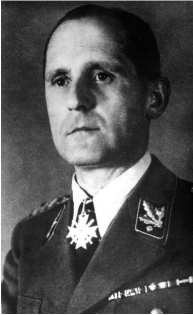
Heinrich Müller, szef Das Geheimes Staatspolizeiamt (Gestapo), tajnej państwowej policji politycznej. Lata 1941 - 1945.

Komitet Oskarżycielski zrezygnował z przedstawienia zarzutów Gustawowi Krupp von Bohlen und Halbachowi. Był to niemiecki przedsiębiorca, prowadzący zakłady przemysłu ciężkiego. Produkował on niemal każdy element wyposażenia niemieckiej maszyny wojennej – począwszy od broni, poprzez działa, okręty podwodne, pociągi, a nawet pojazdy pancerne.