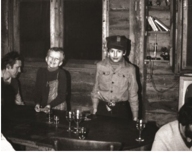
W czapce Mateusz Morawiecki

egzemplarze specjalnego wydania „Biuletynu Dolnośląskiego” rozkładał także dwunastoletni syn Morawieckiego – Mateusz. 14 26 sierpnia 1980 r. strajk ogłoszono we wrocławskiej komunikacji miejskiej. Wraz z nią stanęła większość zakładów Wrocławia. Następnego dnia fala strajków objęła Dolny Śląsk i całą południową Polskę.