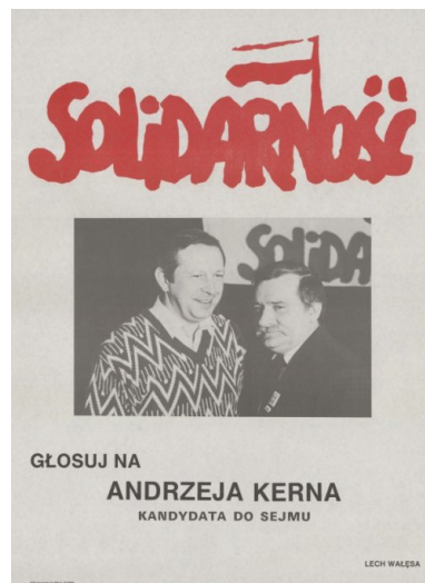
Plakat wyborczy Andrzeja Kerna