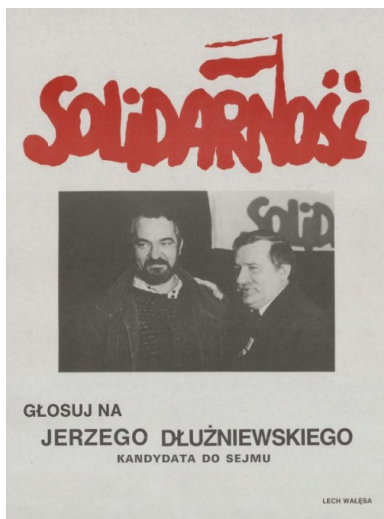
Plakat wyborczy Jerzego Dłużniewskiego