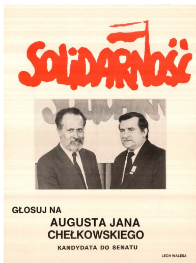
Wybory czerwcowe 1989 r. Plakat kandydata "Solidarności" do Senatu

Trudną do przecenienia rolę w kampanii odegrały rozrzucone w postaci ulotek instrukcje wyborcze. Najskuteczniejsze okazały się tzw. ściągi, na których umieszczono szczegółową informację na kogo głosować, a kogo skreślić (na większości z nich zapisano tylko nazwiska kandydatów KO na senatorów oraz na posłów w poszczególnych okręgach, wraz z zaleceniem, by pozostałe osoby wykreślić). Ulotki tego typu zaczęto rozrzucać już pod koniec kwietnia.