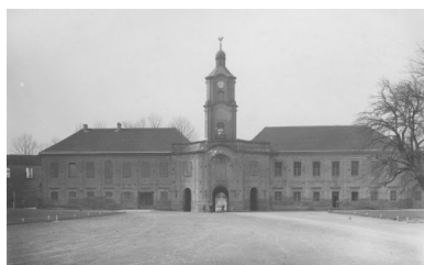
Zamek Radziwiłłów w Ołyce, województwo wołyńskie. Druga Rzeczpospolita. Widok na zamek