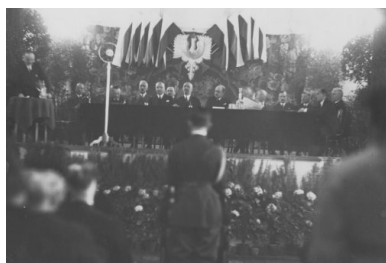
Zjazd gospodarczy Bezpartyjnego Bloku Współpracy z Rządem w Warszawie, 18 maja 1933 r.