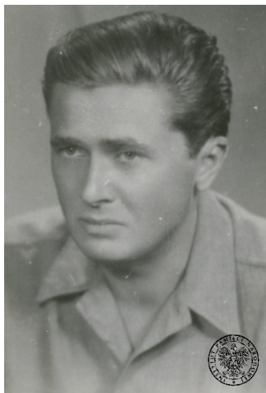
Marek Hłasko.

Tak być może podchodził do kolejnych wezwań, które przychodziły, choć Hłasko zmienił w tym czasie pracę. W sumie między styczniem a kwietniem 1953 r. odbyło się 12 spotkań (na 17 planowanych), z czego 10 uznano za wartościowe. Dokumenty nie wskazują, czy zeznania pisarza pomogły w jakikolwiek sposób w złapaniu konwojentów-oszustów. W każdym razie współpraca nie trwała długo – dość szybko okazało się, że Hłasko przestał być przydatny milicjantom, w dodatku stwierdzono, że raczej nie przyda się w innych śledztwach: jak pisano, „zwolnił się z pracy, aby ukończyć książkę”. Machnięto więc ręką. Ostateczna decyzja o „eliminacji z sieci” zapadła dopiero w listopadzie 1953 r. – milicyjna biurokracja działała wolno.