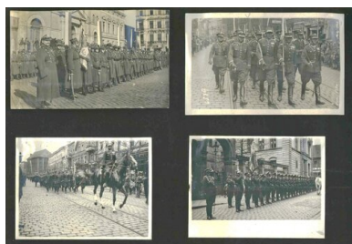
Album fotograficzny porucznika