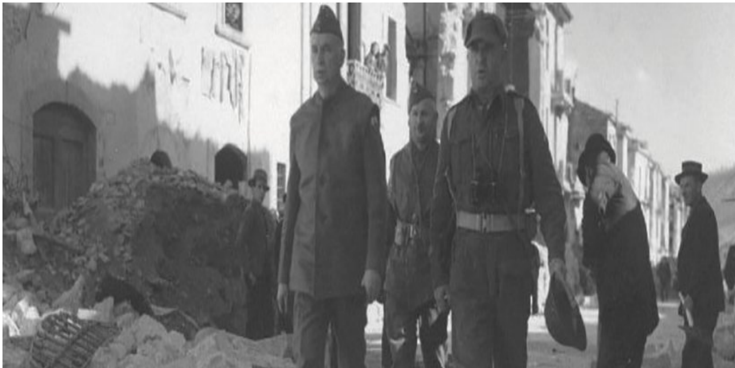
Na pozycje 2. BSK idą (od lewej): Naczelny Wódz gen. Kazimierz Sosnkowski, płk dypl. Roman Szymański i dowódca 5. batalionu strzelców karpackich ppłk Karol Piłat, Castel di Sangro, 30 marca 1944 r.

https://przystanekhistoria.pl/pa2/teksty/68379,Idziemy-w-pelen-chwaly-boj-General-Roman-Szymanski-18951974.html