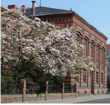
I Liceum Ogólnokształcące im. Bolesława Chrobrego w Grudziądz, przed wojną jako Państwowe Gimnazjum Matematyczno-Przyrodnicze