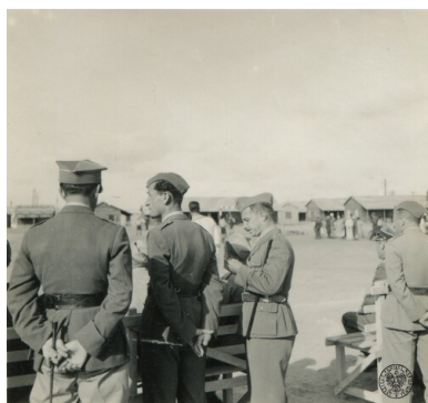
Żołnierze na widowni na meczu piłki nożnej między drużynami Samodzielnej Brygady Strzelców Karpackich i RAF w obozie w Abu