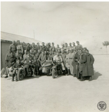
Uczestnicy 1. kursu kierowców pojazdów mechanicznych Samodzielnej Brygady Strzelców Karpackich w Al-Dekheila w Egipcie, styczeń 1941.