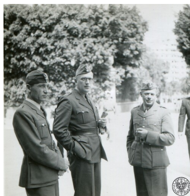
Żołnierze Samodzielnej Brygady Strzelców Karpackich przed kościołem św. Katarzyny w Aleksandrii w Egipcie, Wielkanoc