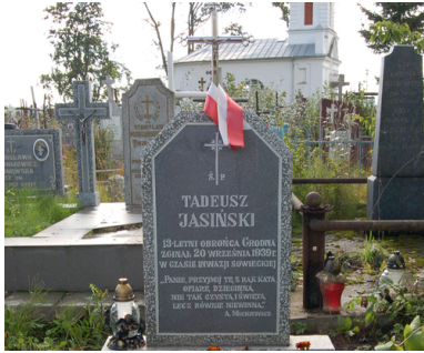
Grób Tadeusza Jasińskiego, najmłodszego obrońcy Grodna

poddano także żołnierzy polskich. Rozstrzelano m.in.: ok. 300 obrońców Grodna czy ok. 150 marynarzy Flotyli Pińskiej, zamordowano gen. Józefa Olszynę-Wilczyńskiego, dowódcę Okręgu Korpusu nr III Grodno i jego adiutanta kpt. artylerii Mieczysława Strzemeskiego.