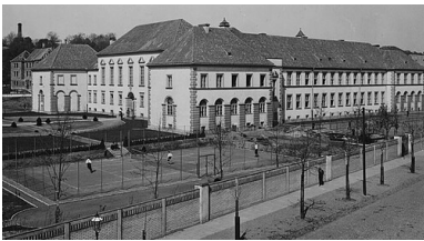
Państwowe Gimnazjum Męskie im. Stefana Batorego w Warszawie, ok. 1925 r.