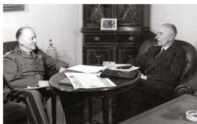
Gen. Władysław Sikorski i prezydent Władysław Raczkiewicz.