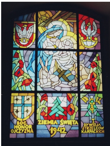
Witraż z wyobrażeniem Matki Bożej u żłóbka, symbolem 3 Dywizji Strzelców Karpackich i napisem "Bóg Honor Ojczyzna - Ziemia Święta 1942 - 3 Dywizja Strzelców Karpackich", Kościół św. Krzyża przy ul. Krakowskie Przedmieście w Warszawie 1997 r.

Po przewrocie majowym dewiza „Honor i Ojczyzna” została potwierdzona przez prezydenta Ignacego Mościckiego rozporządzeniem z 13 grudnia 1927 r. o godłach i barwach państwowych oraz o oznakach, chorągwiach i pieczęciach, a dziesięć lat później – dekretem z 24 listopada 1937 r. o znakach wojska i marynarki wojennej. 2