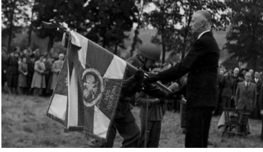
Wręczenie sztandaru 1 Samodzielnej Brygadzie Spadochronowej, 15 czerwca 1944 r.

Projekt dekretu prezydenta RP o zmianie dekretu prezydenckiego z 24 listopada 1937 r. minister Kukiel przedstawił na posiedzeniu Rady Ministrów 24 sierpnia 1943 r. I choć – jak zapisano w protokole – został on „poparty w całości” przez premiera Mikołajczyka i uchwalony, to wywołał dyskusję. Minister Kwapiński zgłosił na piśmie votum separatum . Głos zabierali również minister wyznań religijnych i oświecenia publicznego ks. Zygmunt Kaczyński oraz ministrowie Jan Stańczyk i Stanisław Kot. Ten ostatni, kierujący resortem informacji i dokumentacji, zgodził się na zmianę dekretu, ale „zastrzegł się, by dane słowo «Bóg» miało głębszy sens i stało się rzeczywiście przyczyną podniesienia strony moralnej w wojsku polskim” 14 .