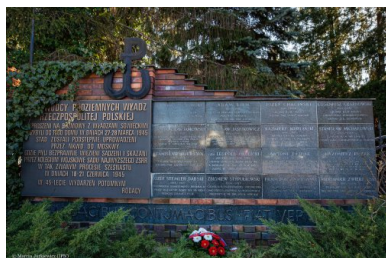
Pomnik szesnastu przywódców Polskiego Państwa Podziemnego

Po wybuchu wojny niemiecko-sowieckiej oraz podpisaniu umowy Sikorski-Majski, 10 września 1941 Pużak zgłosił Delegatowi Rządu RP na Kraj czasowe wstrzymanie się WRN od udziału w PKP. Głównym powodem decyzji kierownictwa WRN, była próba wymuszenia na: premierze, Delegacie Rządu, PKP i SL realizacji zarysowanego powyżej programu. Zakończyła się ona niepowodzeniem głównie z powodu powstania w tym czasie organizacji Polskich Socjalistów, jednoczącej niewielkie konspiracyjne grupy lewicy socjalistycznej, która wkrótce potem została zaproszona do PKP. Uświadomiwszy sobie nieskuteczność podjętej polityki, począwszy od wiosny 1942 r. kierownictwo WRN podjęło wielotorowe działania mające na celu powrót do PKP. Jednocześnie prowadzono rozmowy zjednoczeniowe z organizacją Polskich Socjalistów, które wiosną 1943 r. doprowadziły do jej rozbitcia i przejścia części jej działaczy do WRN. Zbiegło się to z powrotem Pużaka do porozumienia stronnictw. W ciągu kilku kolejnych miesięcy Pużakowi udało się doprowadzić do podpisania 15 sierpnia 1943 r. Deklaracji Porozumienia Politycznego Czterech Stronnictw, która zawierała zarówno cele wojenne Polski, jak i zakładała utworzenie konspiracyjnego surogatu parlamentu – Rady Jedności Narodowej (RJN). Stronnictwa zobowiązały się także do ścisłej współpracy co najmniej do czasu ogłoszenia pierwszych powojennych wyborów.