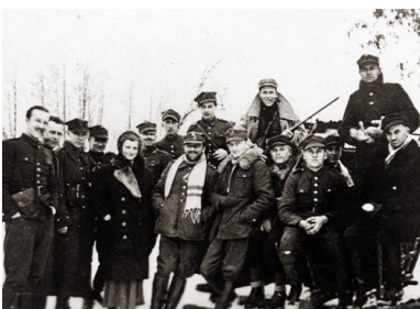
Major Hubal z żołnierzami

Przeprowadzoną przez okupanta niemieckiego akcją represyjną wymierzono bezpośrednio w ludność cywilną zamieszkałą wioski i przysiółki na terenach, na których działał Oddział Wydzielony „Hubala”. Miejscowa ludność dostarczała żołnierzom żywność oraz furaz dla koni, udzielała schronienia, a także przekazywała broń zakopaną w okolicznych lasach we wrześniu 1939 r. Należy podkreślić, że akcja represyjna objęła również swoim zasięgiem wioski, w których Oddział nie kwaterował.