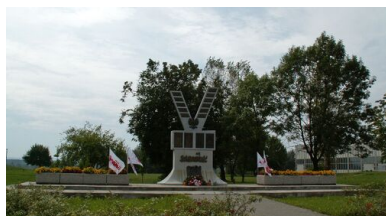
Pomnik Solidarności na pl. Centralnym w Nowej Hucie.

turze, co zmniejszało liczbę mandatów w rękach komunistów. Ku oburzeniu nie tylko członków młodzieżowych organizacji antykomunistycznych, ale zapewne znacznej części głosujących, którzy mozolnie skreślali każde nazwisko z „listy krajowej”, decydenci Komitetu Obywatelskiego „Solidarność” zgodzili się na zmianę ordynacji wyborczej w trakcie wyborów. Dodatkowe wzburzenie wywołała informacja przekazana przez rzecznika rządu Jerzego Urbana, że kandydatem na stanowisko prezydenta będzie Wojciech Jaruzelski.