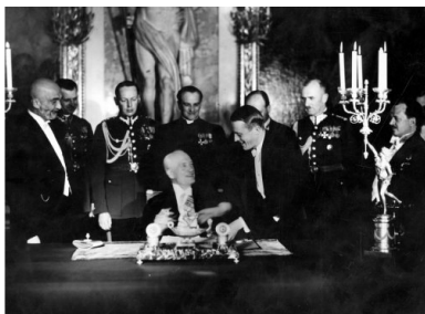
Prezydent RP Ignacy Mościcki podczas podpisywania konstytucji w Sali Rycerskiej na Zamku Królewskim, 23 kwietnia 1935 r.