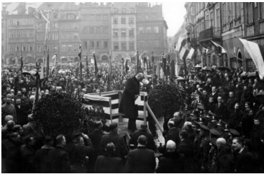
Manifestacja w Warszawie na cześć uchwalenia nowej konstytucji. Wicemarszałek sejmu Stanisław Car opuszcza trybunę po wygłoszeniu przemówienia na Rynku Starego Miasta w Warszawie, marzec 1935 r.

Posłowie BBWR zorientowali się, że mają wymaganą większość i – przy protestach posła Strońskiego – konstytucję uchwalili. Wydawało się wówczas, że – wobec przewagi BBWR w Senacie – proces legislacyjny zostanie zakończony bardzo szybko. Piłsudski jednak zaprosił do siebie premiera Walerego Sławka i marszałka Sejmu Kazimierza Świątalskiego i stwierdził, że „...dla Ustawy Konstytucyjnej uchwalenie jej dowcipem i trikiem nie jest zdrowe i że wobec tego należy ten trik pokryć i zneutralizować przez szczegółową debatę i zmiany w Senacie..”