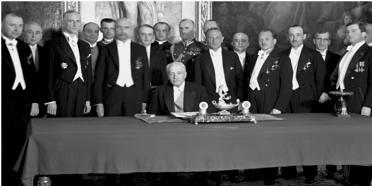
Ceremonia podpisania przez prezydenta RP Ignacego Mościckiego Konstytucji 1935 roku w Sali Rycerskiej na Zamku Królewskim w Warszawie, 23 kwietnia 1935 r.

https://przystanekhistoria.pl/pa2/teksty/66090,Panstwo-polskie-jest-wspolnem-dobrem-wszystkich-obywateli-Konstytucja-z-23-kwiet.html