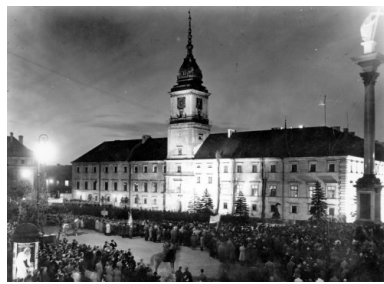
Manifestacja społeczeństwa przed Zamkiem Królewskim podczas ceremonii podpisania przez prezydenta RP Ignacego Mościckiego Konstytucji 1935 r.