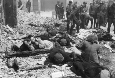
Grupa Żydów schwytyanych przez Niemców w czasie powstania w getcie warszawskim. Fotografia pochodzi z raportu Stroopa.