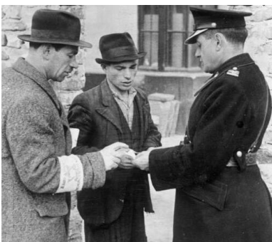
Granatowy policjant kontroluje dokumenty w getcie, 1941 r. (fot. Wikipedia/CC BY-SA 3.0 de/Bundesarchiv, Bild 183-

Sygnalami, że Niemcy szykują „coś” dla mieszkańców getta, były ścisła kontrola dokumentów i rejestracja osób pracujących lub zdolnych do pracy. Pieczętki wbijane w kenkarty stanowiły potwierdzenie tego statusu i były jednocześnie, jak się wówczas wydawało, gwarancją bezpieczeństwa.