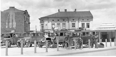
Plac Zgody (obecnie Plac Bohaterów Getta) w 1931 r.

którzy nie otrzymali pieczętek „na życie”, jak je później określano w relacjach. Do transportów w pierwszej kolejności skierowano głównie starszych, chorych, a także kobiety ciężarne i z dziećmi. Nierzadko deportowano kilka osób z jednej rodziny.