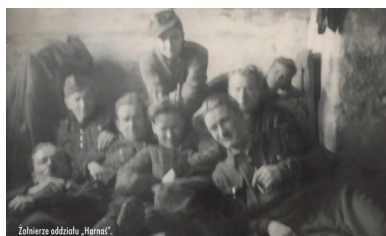
Żołnierze oddziału „Harnaś”.

„zamiarem moim jest skupić wysiłki [polskiego potencjału militarnego] do przygotowania powstania w Polsce, koordynując z nim ruchy wyzwolenicze innych ludów środkowej Europy, przede wszystkim Czechosłowacji”. 1