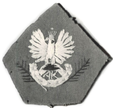
Patka płk. Franciszka Faixa.