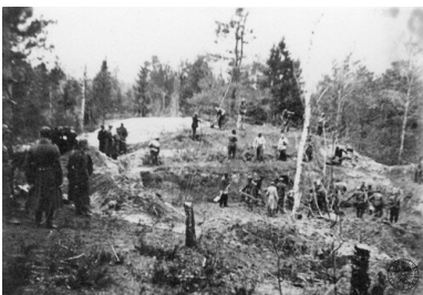
Pierwsza ekshumacja zamordowanych przez NKWD oficerów Wojska Polskiego w Katyniu zlecona przez Niemców. Prace ekshumacyjne przy grobach, pracują jeńcy sowieccy.