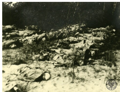
Leżące na piasku zwłoki polskich oficerów zamordowanych przez NKWD wydobyte z grobu w Lesie Katyńskim. Niektóre zwłoki ułożone twarzą do ziemi. Zdjęcie