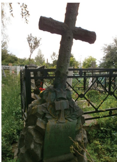
Grób ks. Erazma Wierzejskiego w Mohylewie Podolskim. Fot. ze zbiorów Jerzego Wójcickiego

JW: To też mogło odegrać swoją rolę. Uderza jednak fakt, że Niemcy podali liczbę kilkudziesięciu odnalezionych Polaków, a to wydaje mi się celowym działaniem – jakby chodziło im o zmniejszenie skali mordy osób polskiej narodowości.