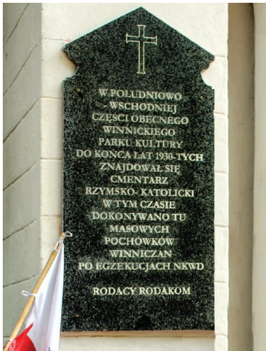
Tablica na budynku dawnej katolickiej kaplicy w Winnicy odsłonięta 31 sierpnia 2014 r.

Na początku maja tego roku dotarł do nas sygnał o planach wsparcia naszych inicjatyw ze strony Fundacji „Pomoc Polakom na Wschodzie”. Może już wkrótce zdołamy opracować kolejną część skanów z kijowskiego Archiwum Służby Bezpieczeństwa Ukrainy, gdzie są przechowywane materiały NKWD. Chodzi o dokumenty, które potwierdzą, że ofiary były mordowane właśnie w Winnicy, Berdyczowie, Płoskirowie, Mohylewie Podolskim... Musimy mieć dowody, żeby udaremnić starania obrońców komunizmu, którzy podważają nasze ustalenia.