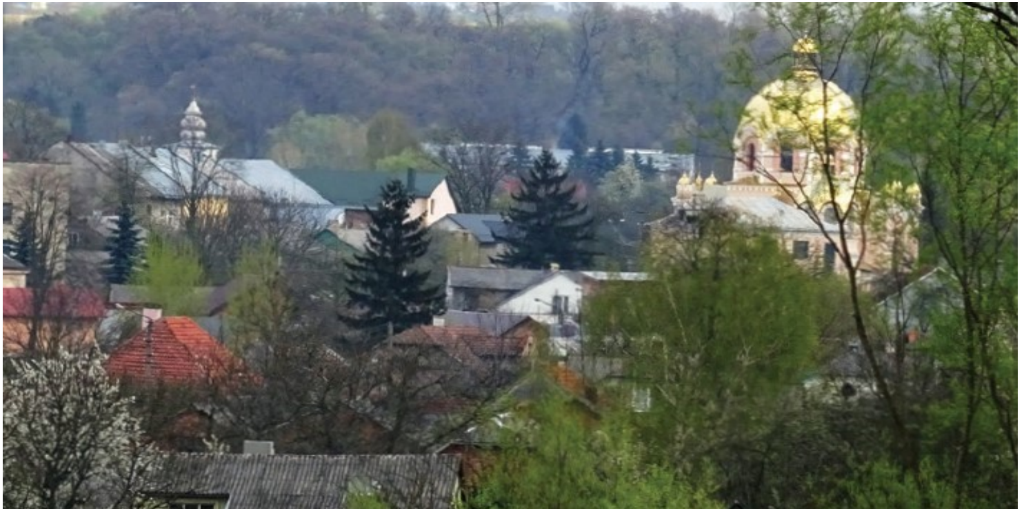
Szukam prawdy o „podolskim Katyniu”

https://przystanekhistoria.pl/pa2/teksty/64944,Szukam-prawdy-o-podolskim-Katyniu.html