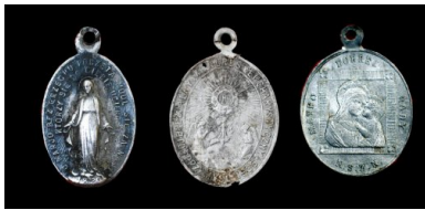
Bykownia - Cmentarzysko Ofiar Zbrodni Stalinowskich. Medaliki katolickie, z napisami w języku polskim znalezione w grobach nr 144/06 i 148/06.