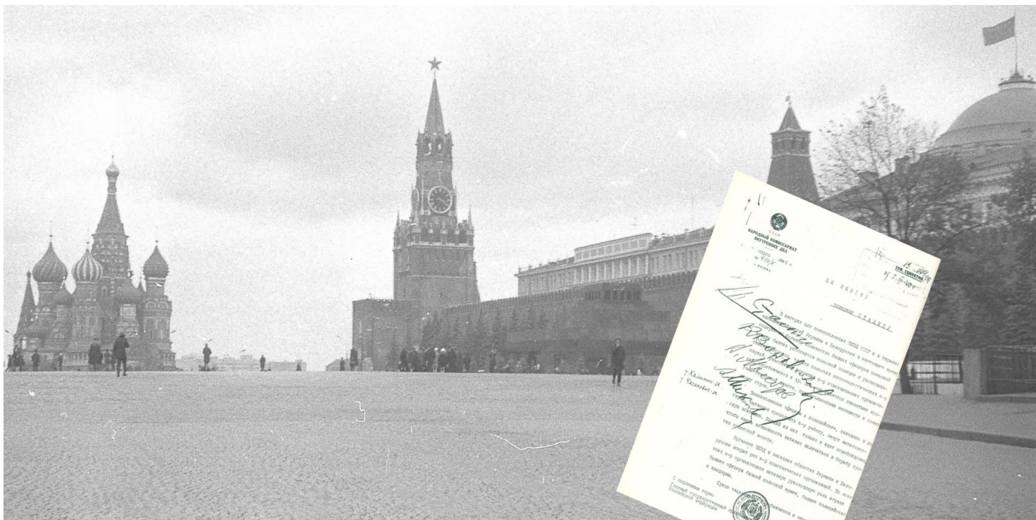
Kreml. Tu rosyjscy komuniści zdecydowali o ludobójczym wymordowaniu elit narodu polskiego.

https://przystanekhistoria.pl/pa2/teksty/64344,Mord-na-wiezniach-mniej-znana-strona-Zbrodni-Katynskiej.html