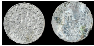
Bykownia - Cmentarzysko Ofiar Zbrodni Stalinowskich. Polskie monety z lat 1923 - 1934 znalezione w grobach nr 83/06 i 139/06.