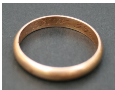
Bykownia - Cmentarzysko Ofiar Zbrodni Stalinowskich. Złota obrączka znaleziona podczas badań prowadzonych w 2007 roku z wygrawerowaną datą 23.IV.39 oraz inicjałami L.L - grób 158/06.

Nie wiemy, czy tzw. białoruska lista katyńska się zachowała. W każdym razie od ćwierć wieku, bo od takiego czasu jest ona poszukiwana, ani z Białorusi, ani z Rosji nie napłynęły informacje o jej odnalezieniu. Mimo to trzeba żywić nadzieję, że w przyszłości uda się przywrócić narodowej pamięci i historii tożsamość zamordowanych.