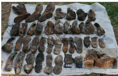
Bykownia - Cmentarzysko Ofiar Zbrodni Stalinowskich. Polskie obuwie wojskowe znalezione w grobie nr 152/06.

Z miejsca rodzi się pytanie: dlaczego szef NKWD polecił wywieźć w głąb ZSRS – ewidentnie na egzekucję, choć w jego rozkazie cel przetransportowania więźniów nie jest wskazany – „jedynie” 6 tys. więźniów? Przecież, jak podano wyżej, łącznie rozstrzelano ich więcej – 7 305. Wyjaśnienia tego fenomenu należy szukać w praktyce ciągłego przenoszenia aresztowanych – z więzienia do więzienia – przy czym generalny kierunek owego przetrzymywania był oczywisty: na wschód. W końcu marca 1940 r., kiedy Beria wydawał swój rozkaz, nie wszyscy więźniowie, których postanowiono zgładzić, znajdowali się wciąż w więzieniach tzw. Zachodniej Ukrainy i Zachodniej Białorusi. Część z nich została wywieziona na wschód już wcześniej. Wiadomo na przykład, że niektórzy z nich trafili do więzień w Chersoniu, a także w Nikołajewie koło Chersonia. Rozkaz uwzględniał zatem stan faktyczny – nie było sensu dysponowania przewozu 1 305 więźniów na terytorium sowieckie, skoro już się tam znajdowali.