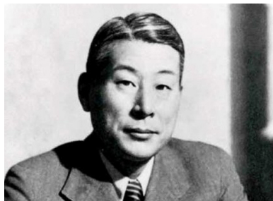
Chiune Sugihara (1900-1986)

W 1985 r. przyznano mu odznaczenie Yad Vashem.