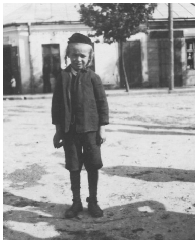
Dziecko żydowskie z Rudnika nad Sanem na zdjęciu z okresu międzywojennego.

podpowiedział mu, aby szedł dalej, do miejscowości Nowe Piekuty. W ten sposób Fajwiszys trafił do młodego księdza – Stanisława Falkowskiego.