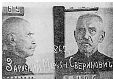
Mariusz Zaruski, zdjęcie identyfikacyjne z więzienia NKWD 1940-41 r.

Malarz, poeta, taternik, grotołaz, narciarz, klimatolog, wydawca i dziennikarz, pisarz, żołnierz, kawalerzysta, marynarz i żeglarz, harcerz i wychowawca młodzieży. Tytan pracy, organizacji, schematów, nakazów i instrukcji. Był człowiekiem żelaznej konsekwencji i woli.