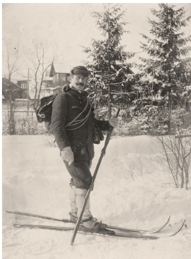
Mariusz Zaruski na nartach, około 1906 r.