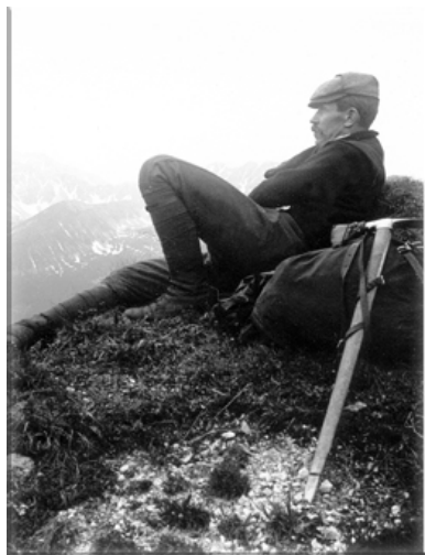
Mariusz Zaruski w Tatrach, przed 1908 r.

Do czasów Zaruskiego Tatry były zimą puste. Do legendy przeszły jego pionierskie zjazdy z Koziego Wierchu i Kościelca na – jakże niedoskonałych jeszcze wtedy – nartach. Porządkował wszystko: od przepisów poruszania się w górach po wyporność łodzi pływających po Morskim Oku. Był organizatorem pierwszych kursów narciarskich, autorem pierwszego podręcznika narciarskiego. Ani wcześniej ani później Tatry nie miały takiego gospodarza.