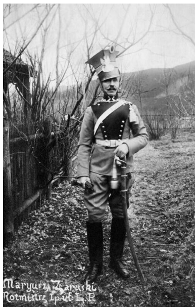
Mariusz Zaruski, rotmistrz I Pułku Ułanów Legionów Polskich, około 1915 r.

Był to pierwszy tego rodzaju podręcznik w polskim wojsku. I od 1919 r. stał się oficjalnym regulaminem polskiej kawalerii czasu wojny.