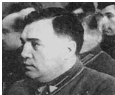
Michaił Frinowski (1900-1940)

16 lipca 1937 r. pojawił się podpisany przez zastępcę Jeżowa, Michaiła Frinowskiego, cyrkularz nr 51 o konfiskowaniu książeczek pracowniczych osobom, które przed uwięzieniem pobierały świadczenie emerytalne. Chodziło o to, że więźniowie emeryci lub ci, którzy pobierali emerytury za wysługę lat, przekazywali upoważnienia lub oddawali swoje książeczki rodzinom. Zatem bliscy takich więźniów przez jakiś czas mogli dostawać indywidualne czy akademickie emerytury. Od lipca 1937 r. naczelnicy organów NKWD osobiście odpowiadali za konfiskatę książeczek podczas aresztowania.