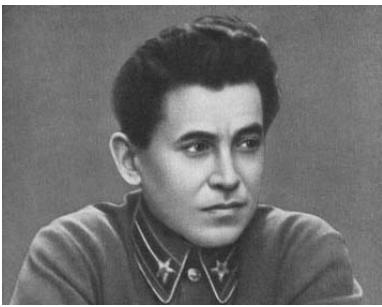
Nikołaj Jeżow (1895-1940)

Jeżow ostro skrytykował „biurokratyczne” podejście w działaniach kierownictw przedsiębiorstw i instytucji państwowych, co, według niego, utrudniało wykrywanie „szkodników” i „szpiegów”. Stało się jasne, że fala krwawych czystek i dekonspiracji nie ominie nikogo.