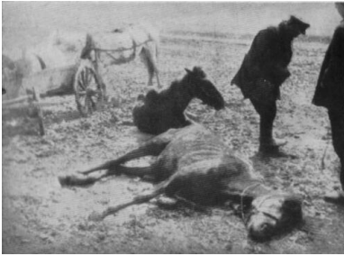
Wielki Głód na Ukrainie (okolice Charkowa, 1933 r.)