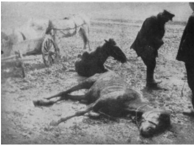
Wielki Głód na Ukrainie (okolice Charkowa, 1933 r.)