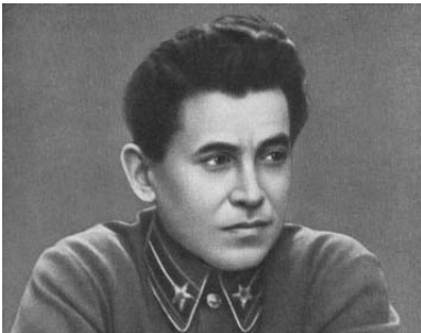
Nikołaj Jeżow (1895-1940)

Jeżow ostro skrytykował „biurokratyczne” podejście w działaniach kierownictw przedsiębiorstw i instytucji państwowych, co, według niego, utrudniało wykrywanie „szkodników” i „szpiegów”. Stało się jasne, że fala krwawych czystek i dekonspiracji nie ominie nikogo.