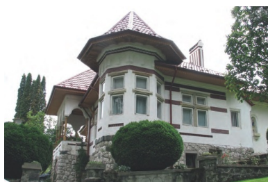
Dragoslavele, przedwojenna willa patriarchy Mirona, miejsce przymusowego pobytu marsz. Edwarda Śmigłego-Rydza 1939-1940 r.

Rozkaz w sprawie przyjęcia polskich uchodźców cywilnych i wojskowych Prefektura w Câmpulung-Muşcel, mieście w południowej Rumunii, otrzymała już 9 września 1939 r. 2 Szczegółowe instrukcje rumuńskiego Ministerstwa Sił Zbrojnych (MAN), dotyczące internowania polskich żołnierzy, dotarły do miejscowego garnizonu pod koniec września. Pierwsi polscy żołnierze znaleźli się w Câmpulung-Muşcel między 28 września a 4 października 1939 r. Przybyłych rozlokowywano początkowo w kwaterach prywatnych. Na początku października w miejscowym garnizonie zarejestrowano 1090 żołnierzy, w tym 1 oficera wyższego i 45 oficerów niższych oraz 1044 podoficerów i szeregowych. Przewidywano, że umieszczonych tu zostanie 1500 żołnierzy polskich. W przeciwieństwie do innych obozów, nie było tu rodzin wojskowych. Pod koniec października 1939 r. liczba internowanych wzrosła i wynosiła 6 wyższych oficerów, 54 oficerów niższych, 130 podoficerów i 855 szeregowych. W ciągu miesiąca ubyło ze stanu osobowego 59 podoficerów i szeregowych; najprawdopodobniej żołnierze ci zbiegli lub zostali przeniesieni do innych obozów. Przyjechało natomiast 63 urzędników cywilnych WP; tak więc w sumie w tym czasie obóz liczył 1108 internowanych.