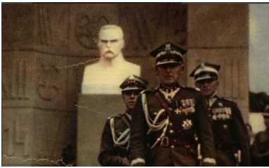
Marszałek Edward Śmigły-Rydz podczas uroczystości 6 sierpnia 1939 w Krakowie, "Światowid" 1939, nr 33