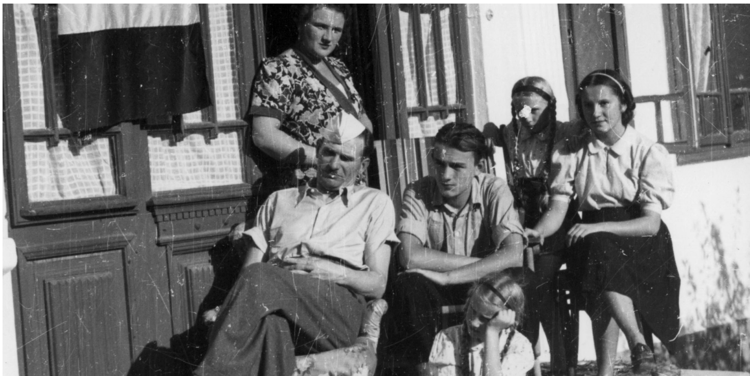
Uchodźcy polscy w Rumunii, 1939/1940 r.

https://przystanekhistoria.pl/pa2/teksty/64194,Polscy-uchodzcy-w-Cmpulung-Mucel-w-Rumunii.html