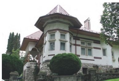
Dragoslavele, przedwojenna willa patriarchy Mirona, miejsce przymusowego pobytu marsz. Edwarda Śmigłego-Rydza 1939-1940 r.

Rozkaz w sprawie przyjęcia polskich uchodźców cywilnych i wojskowych Prefektura w Câmpulung-Muşcel, mieście w południowej Rumunii, otrzymała już 9 września 1939 r. 2 Szczegółowe instrukcje rumuńskiego Ministerstwa Sił Zbrojnych (MAN), dotyczące internowania polskich żołnierzy, dotarły do miejscowego garnizonu pod koniec września. Pierwsi polscy żołnierze znaleźli się w Câmpulung-Muşcel między 28 września a 4 października 1939 r. Przybyłych rozlokowywano początkowo w kwaterach prywatnych. Na początku października w miejscowym garnizonie zarejestrowano 1090 żołnierzy, w tym 1 oficera wyższego i 45 oficerów niższych oraz 1044 podoficerów i szeregowych. Przewidywano, że umieszczonych tu zostanie 1500 żołnierzy polskich. W przeciwieństwie do innych obozów, nie było tu rodzin wojskowych. Pod koniec października 1939 r. liczba internowanych wzrosła i wynosiła 6 wyższych oficerów, 54 oficerów niższych, 130 podoficerów i 855 szeregowych. W ciągu miesiąca ubyło ze stanu osobowego 59 podoficerów i szeregowych; najprawdopodobniej żołnierze ci zbiegli lub zostali przeniesieni do innych obozów. Przyjechało natomiast 63 urzędników cywilnych WP; tak więc w sumie w tym czasie obóz liczył 1108 internowanych.