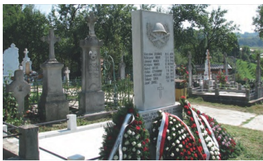
Câmpulung-Mușcel, cmentarz Flamandzki, mogiła uchodźców polskich, zmarłych w latach 1939-1944 r.