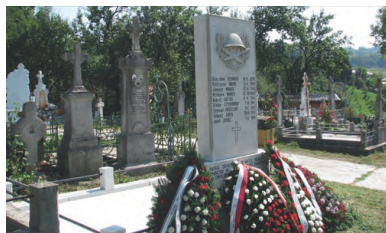
Câmpulung-Mușcel, cmentarz Flamandzki, mogiła uchodźców polskich, zmarłych w latach 1939-1944 r.