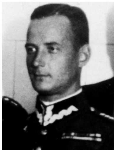
Płk Franciszek Niepokólczycki - fotografia przedwojenna z akt gestapo w Łodzi.

Franciszek Niepokólczycki urodził się w 1901 r. w Żytomierzu – dzisiaj znajdującym się na Ukrainie. Na początku XX w. był to ważny ośrodek polskości na Kijowszczyźnie, ale w konsekwencji pokoju ryskiego pozostał po stronie bolszewickiej. Znaczna część tamtejszych Polaków uległa zagładzie lub wynarodowieniu w Związku Sowieckim.