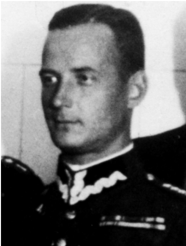
Płk Franciszek Niepokólczycki - fotografia przedwojenna z akt gestapo w Łodzi.

Franciszek Niepokólczycki urodził się w 1901 r. w Żytomierzu – dzisiaj znajdującym się na Ukrainie. Na początku XX w. był to ważny ośrodek polskości na Kijowszczyźnie, ale w konsekwencji pokoju ryskiego pozostał po stronie bolszewickiej. Znaczna część tamtejszych Polaków uległa zagładzie lub wynarodowieniu w Związku Sowieckim.