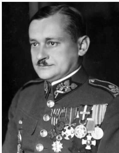
Gen. Lev Prachla.

Na zaistniałą sytuację zareagował również ruch oporu w „protektoracie”. Na północno-wschodnich Morawach powstała gęsta sieć osób zajmujących się przeprowadzaniem ludzi przez granicę: polityków, obywateli żydowskiego pochodzenia, a latem 1939 r. – przede wszystkim żołnierzy. Trasy działały niezawodnie – duża w tym zasługa m.in. kolejarzy. Jednym z ważnych czynników, które wzmocniły ruch oporu w „protektoracie”, było rozpoczęcie czeskich emisji radiowych z Katowic.