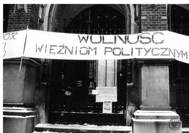
Strajk okupacyjny studentów Uniwersytetu Jagiellońskiego w Krakowie w lutym 1981 roku (wejście do budynku głównego Uniwersytetu).

Do senatu, kolegium rektorskiego i rad wydziałów wchodził też jako pełnoprawni ich członkowie reprezentanci PZPR, w programach nauczania znajdowały się przedmioty ideologiczne (jak np. ekonomia polityczna), a studenci pozbawieni byli dostępu do księgozbiorów zastrzeżonych. Brać studencka krytykowała takie funkcjonowanie polskich uczelni.