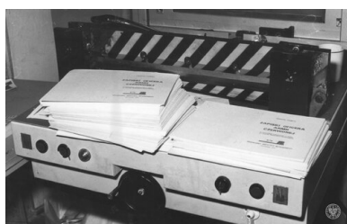
Materiały z wystawy pt. „Od porozumień społecznych do sięgania po władzę”, zorganizowanej przez Biuro "C" w gmachu MSW przy ul. Rakowieckiej i obrazującej działalność opozycyjną w latach 1980-1982. Na powielaczu nielegalna w PRL powieść Sergiusza Piaseckiego "Zapiski