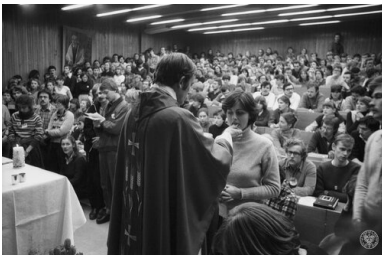
Msza święta podczas strajku studentów Akademii Medycznej w Warszawie w sprawie rejestracji Niezależnego Zrzeszenia Studentów. Mszę celebrował ks. Jerzy Popiełuszko. 16 lutego 1981.